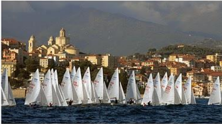
IMPERIA WINTER REGATTA 2009